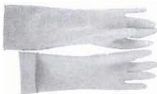
Рисунок - Вид перчаток (рукавиц) резиновых

Перчатки (рукавицы) резиновые должны соответствовать ГОСТ 20010.