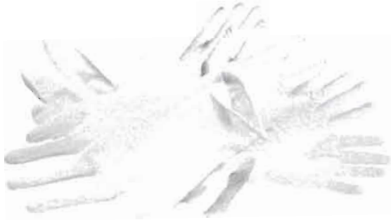
Рисунок - Вид перчаток медицинских, одноразовых одноразовые

Перчатки Медицинские одноразовые должны соответствовать ГОСТ Р 52239-2004 (ИСО 11193-1:2008)