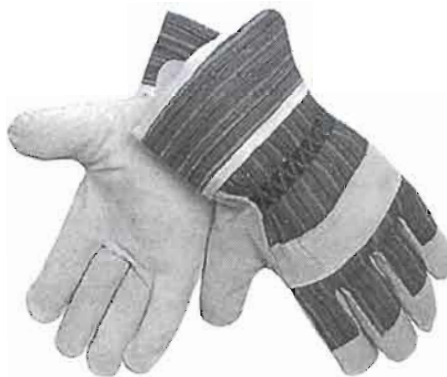
Рисунок - Вид перчаток рабочих

Перчатки рабочие изготавливаются из х/б ткани с коженным спилком. Изготовление перчаток рабочих должно быть в соответствии с ГОСТ 12.4.183-91 модель К-701.